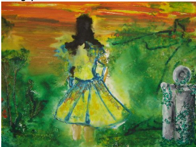
Werk: Hans van der Heide

Alhoewel dit niet een project is, wat onder Project Ulrum 2034 valt, willen we het toch weer benoemen. Helaas bereiken ons nog steeds berichten over vandalisme in dit park. Dit blijkt dus heel moeilijk uitroeibaar te zijn. Het park is, evenals de aanpalende ijsbaan, nog steeds nadrukkelijk in beeld om direct betrokken te worden bij het Wierdenherstelplan. Ook is een deel (bij de school) van het park in beeld voor schoolmoestuinen (onderdeel van GroenLab). Inmiddels zijn de eerste positieve gesprekken hierover gevoerd met de schoolleiding.